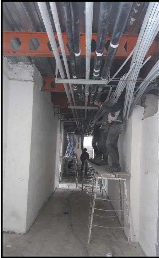
۷- اجرای عایق حرارتی - EPDM - لوله‌های تاسیساتی