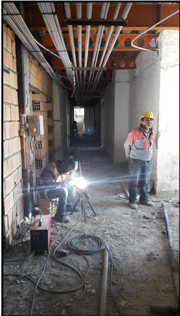
۸- نصب کابین آسانسور ۹- عملیات برشکاری و اتصال لوله‌های تاسیساتی