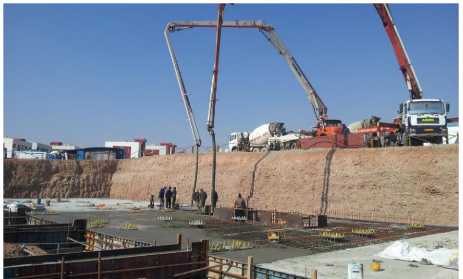
نمایی از عملیات بتن ریزی پارت آخر فونداسیون سازه اصلی (بلوک A) (حجم بتن حدود ۳۰۳ مترمکعب)