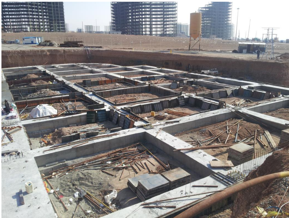
تکمیل عملیات قالب برداری فونداسیون سازه پارکینگ