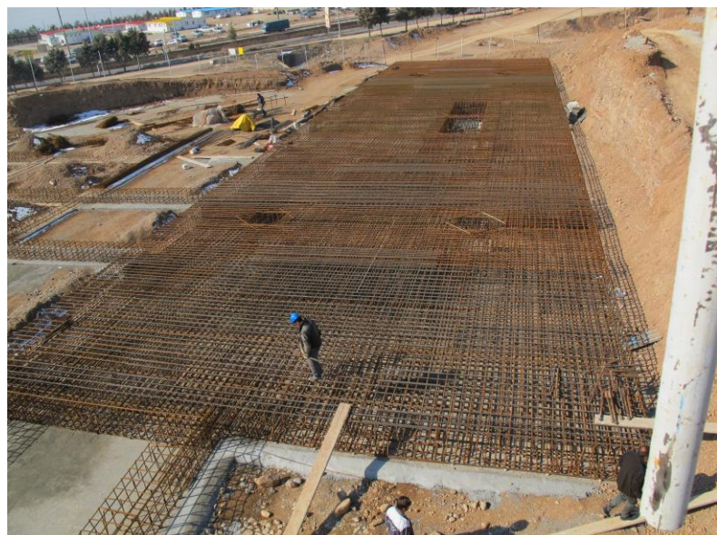
نمای کلی از آرماتوربندی انجام شده در فونداسیون سازه اصلی