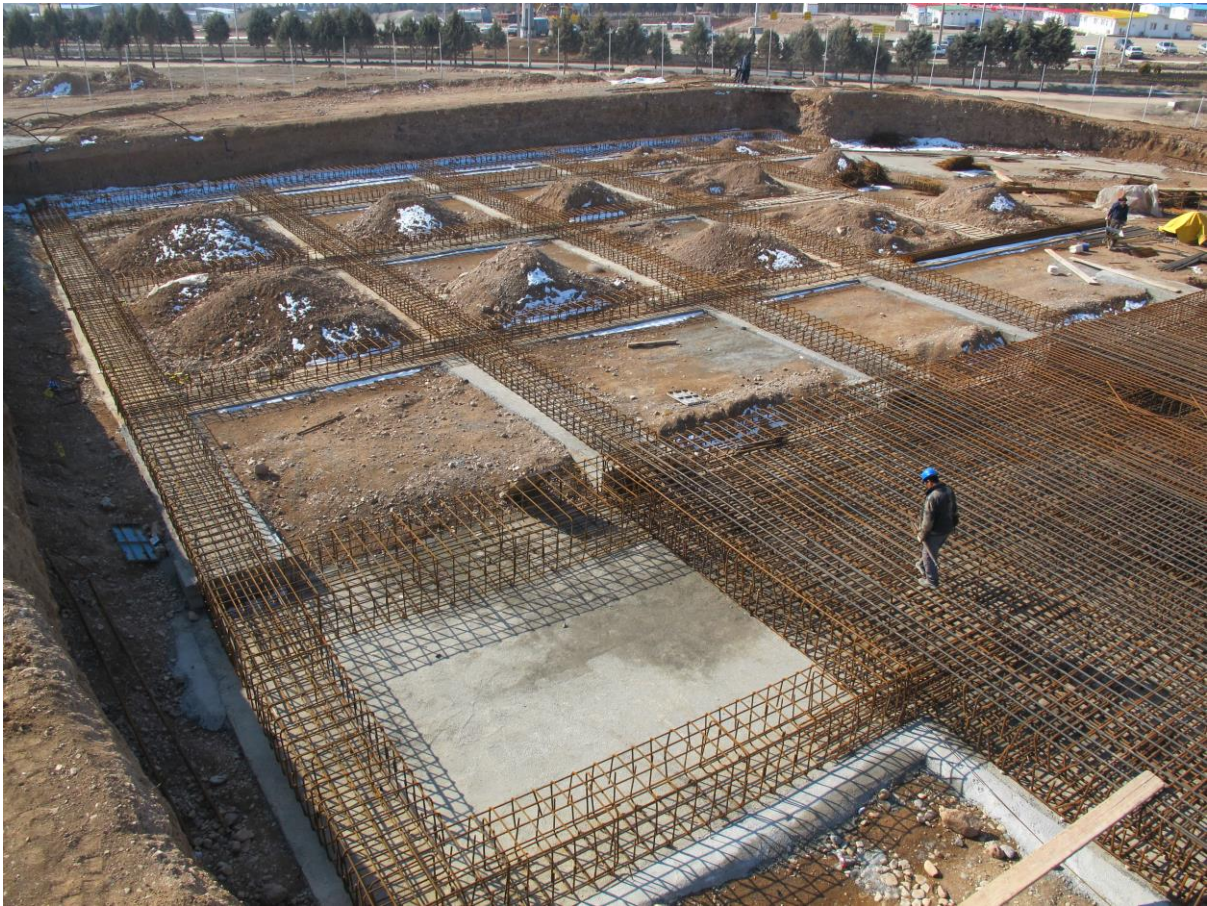
نمای کلی از آرماتوربندی انجام شده فونداسیون سازه پارکینگ (بلوک C)