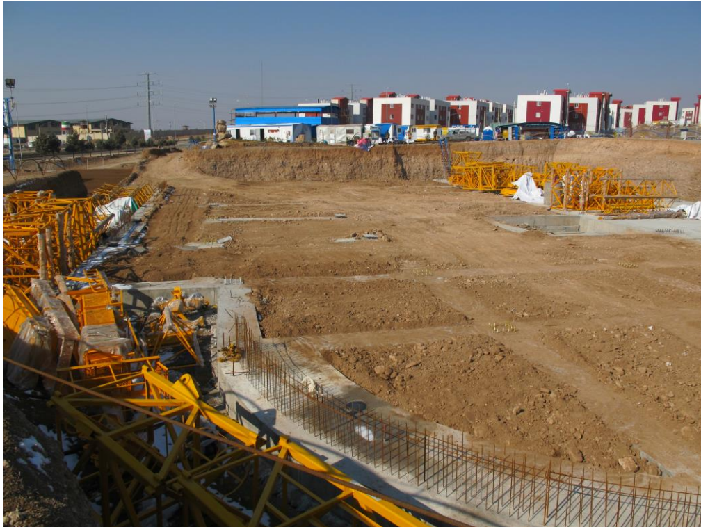
عملیات خاکریزی ما بین فونداسیون های نواری سازه پارکینگ (بلوک A)