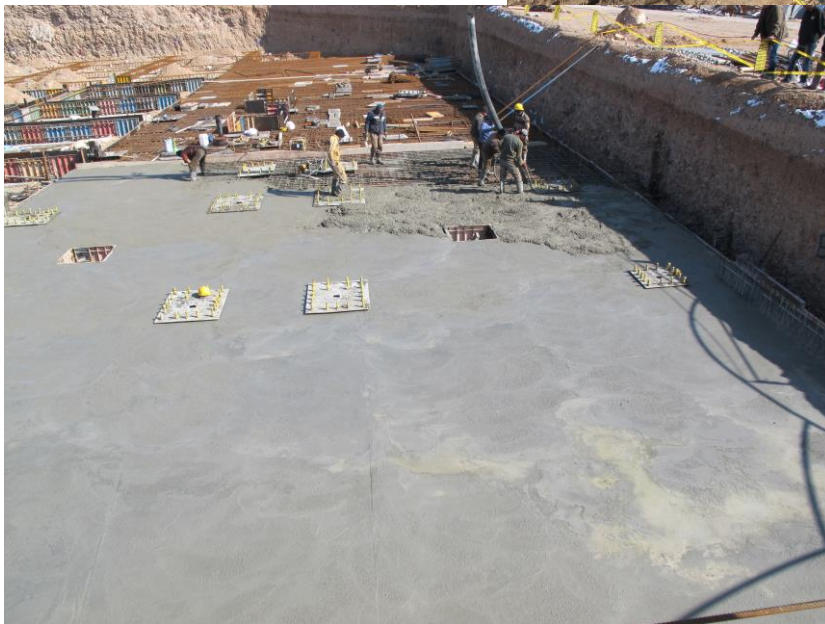
نمایی از عملیات بتن ریزی بارت اول فونداسیون های سازه اصلی و پارکینگ (بلوک B)