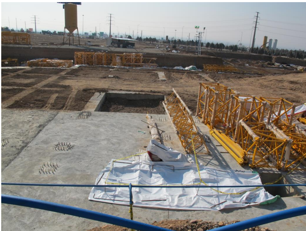
نمایی از آغاز آماده سازی محل نصب تاور کرین مرکزی (بلوک A)