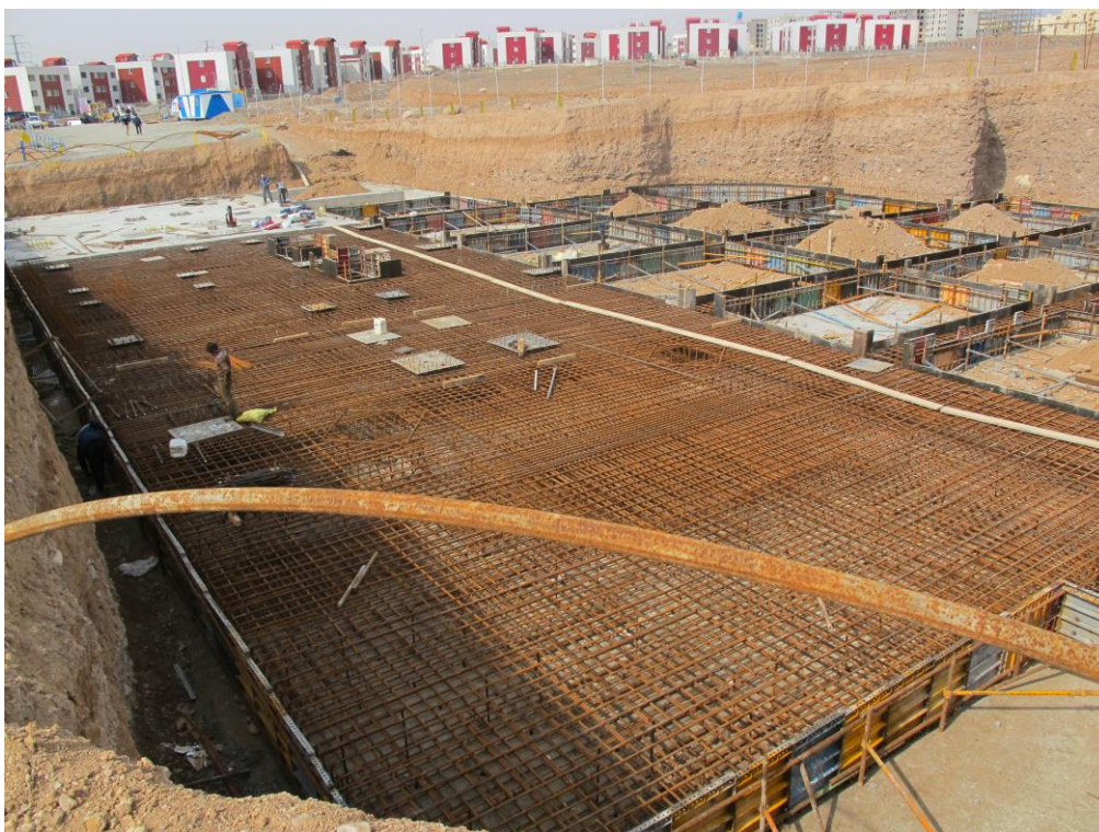
نمایی از آرماتور بندی و قالب بندی انجام شده در فونداسیون سازه اصلی و پارکینگ (بلوک B)