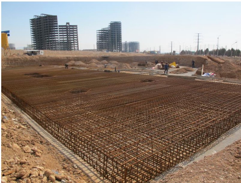
نمایی از آرماتوربندی انجام شده در فونداسیون سازه اصلی