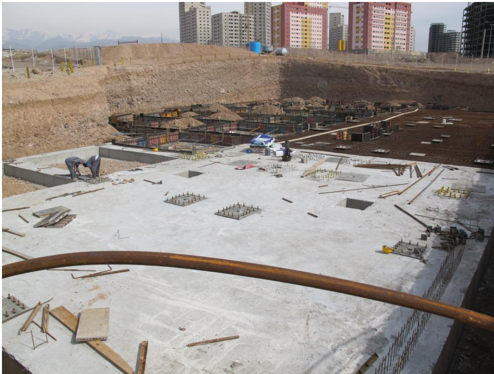
نمایی از فونداسیون سازه اصلی پس از بتن ریزی پارت اول (بلوک B)