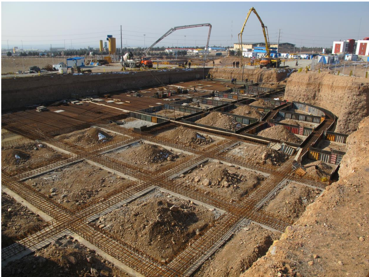
نمای کلی از فونداسیون سازه اصلی و پارکینگ